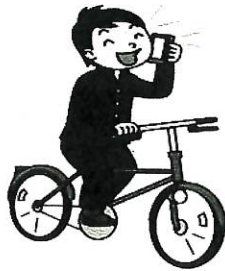
ながらスマホ禁止