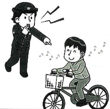
イヤホンをしながら運転禁止